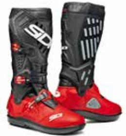
RED | BLACK ROSSO | NERO