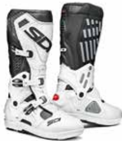
BLACK | WHITE NERO | BIANCO