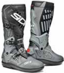
GREY | BLACK