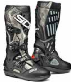
LEAD GREY | BLACK GRIGIO PIOMBO | NERO