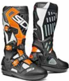
WHITE | BLACK | ORANGE FLUO BIANCO | NERO | ARANCIO FLUO