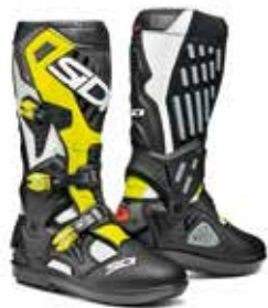
WHITE | BLACK | YELLOW FLUO BIANCO | NERO | GIALLO FLUO