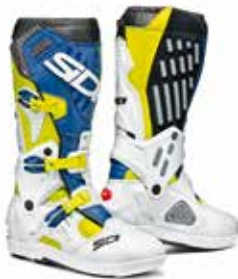
YELLOW FLUO | WHITE | BLU GIALLO FLUO | BIANCO | BLU