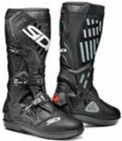
BLACK | BLACK